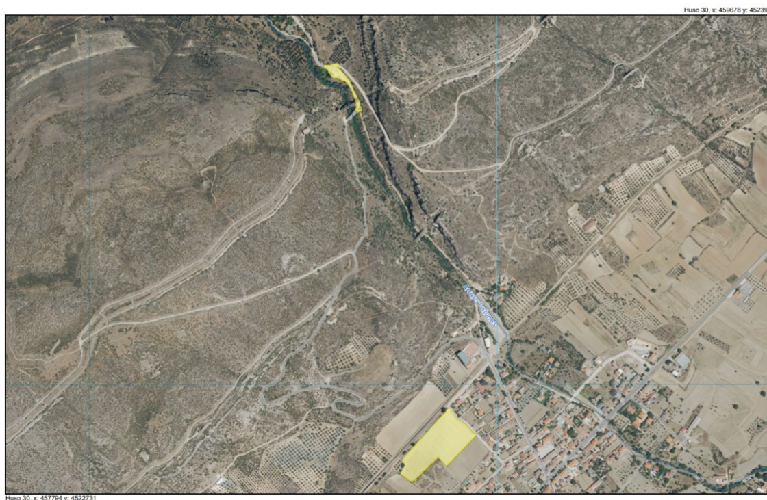
Figura 1. Ámbitos de actuación sobre ortofotografía PNOA de máxima actualidad