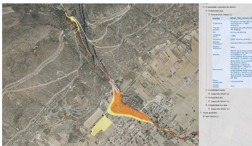
Figura 4. Zonas inundables del arroyo Patones

El ámbito de planeamiento norte destinado a la creación de una rotonda en la carretera M-912 se sitúa íntegramente en la zona de policía de cauces, por tanto, la ejecución de las obras que se deriven del mismo estarán sometidas a lo previsto en el artículo 9 del Reglamento del Dominio Público Hidráulico.