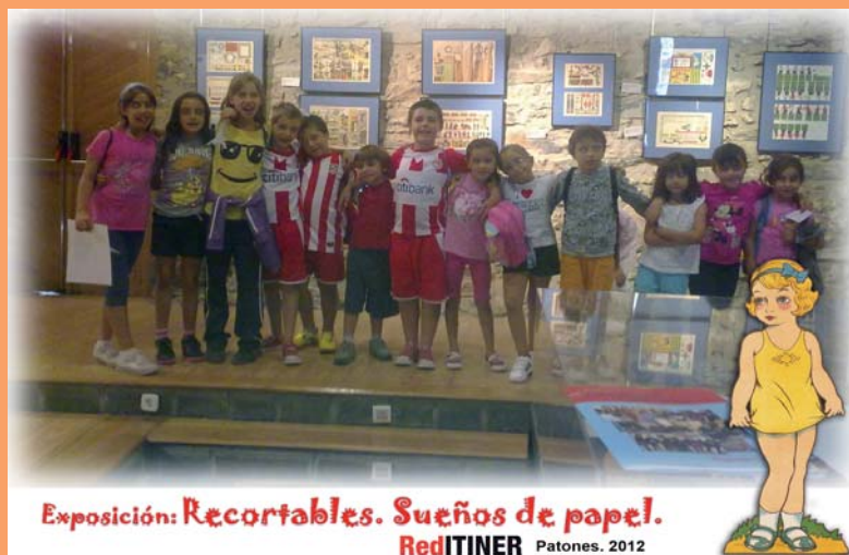
Exposición: Recortables. Sueños de papel. RedITINER Patones. 2012

Si estás interesado en exponer en la sala de exposiciones de CITECO ponte en contacto con la Concejalía de Cultura del municipio. cultura@patones.net