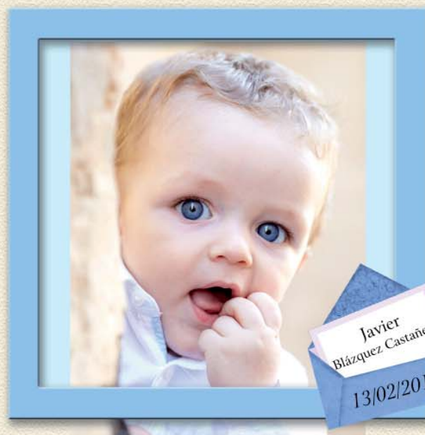
Javier Blázquez Castañeda 13/02/2017