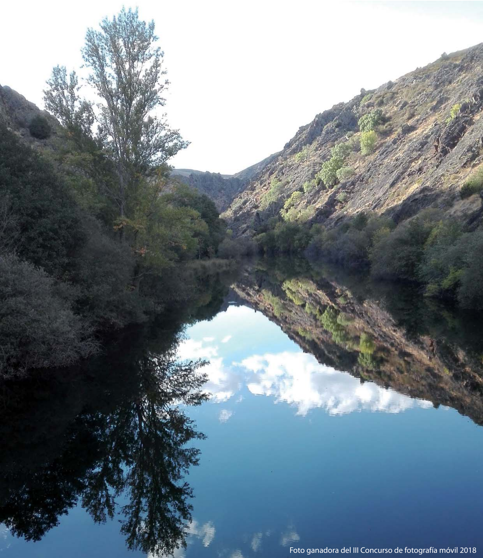
Foto ganadora del III Concurso de fotografía móvil 2018

Edita: Ayuntamiento de Patones - ayuntamiento@patones.net - www.patones.net